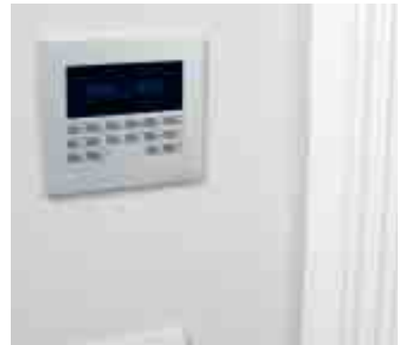
Die Bedienelemente der Trivium-Anlage geben keinerlei Rätsel auf