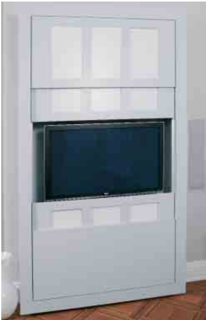
Bildschirm im Einsatz: Der Plasma von NEC...