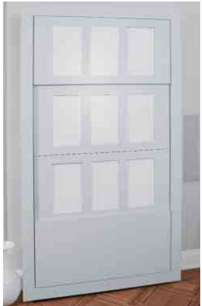
...versteckt sich hinter zwei Schiebeelementen, wenn er nicht benötigt wird