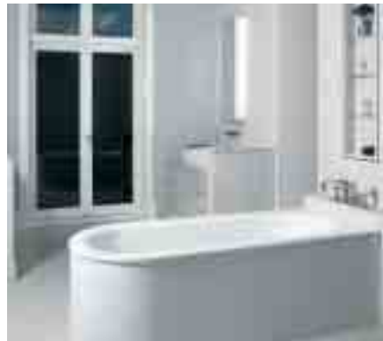
Im Bad genießt man die wenigen ruhigen Momente des Tages mit bester Beschallung aus dem Multirom-System