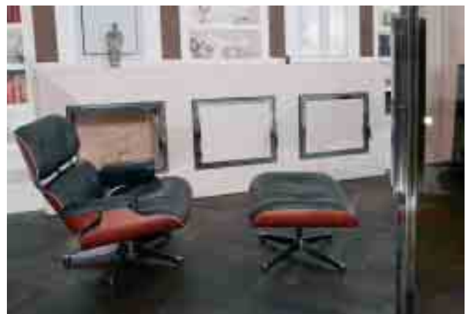
Blick in die Bibliothek: Der Eames Chair wird in den wenigen Stunden der Muße zum Genussmittel