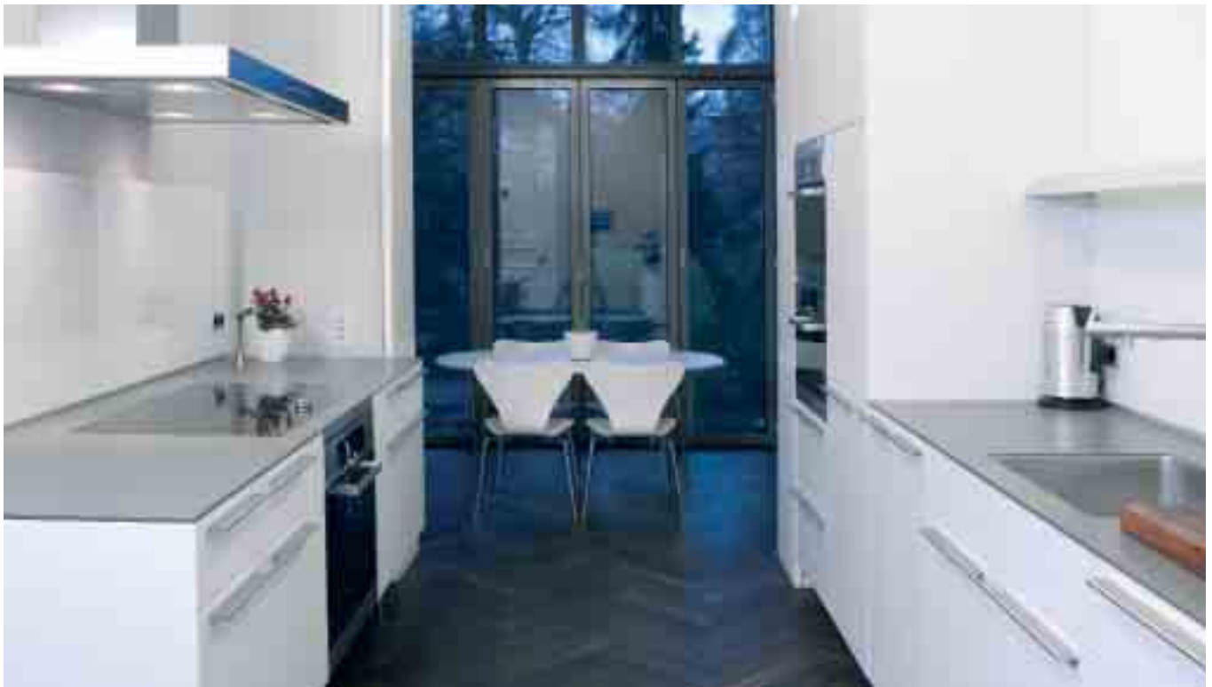
Die Küche mit Blick zum Wintergarten ist – wie so oft – zentrale Anlaufstelle im Haus