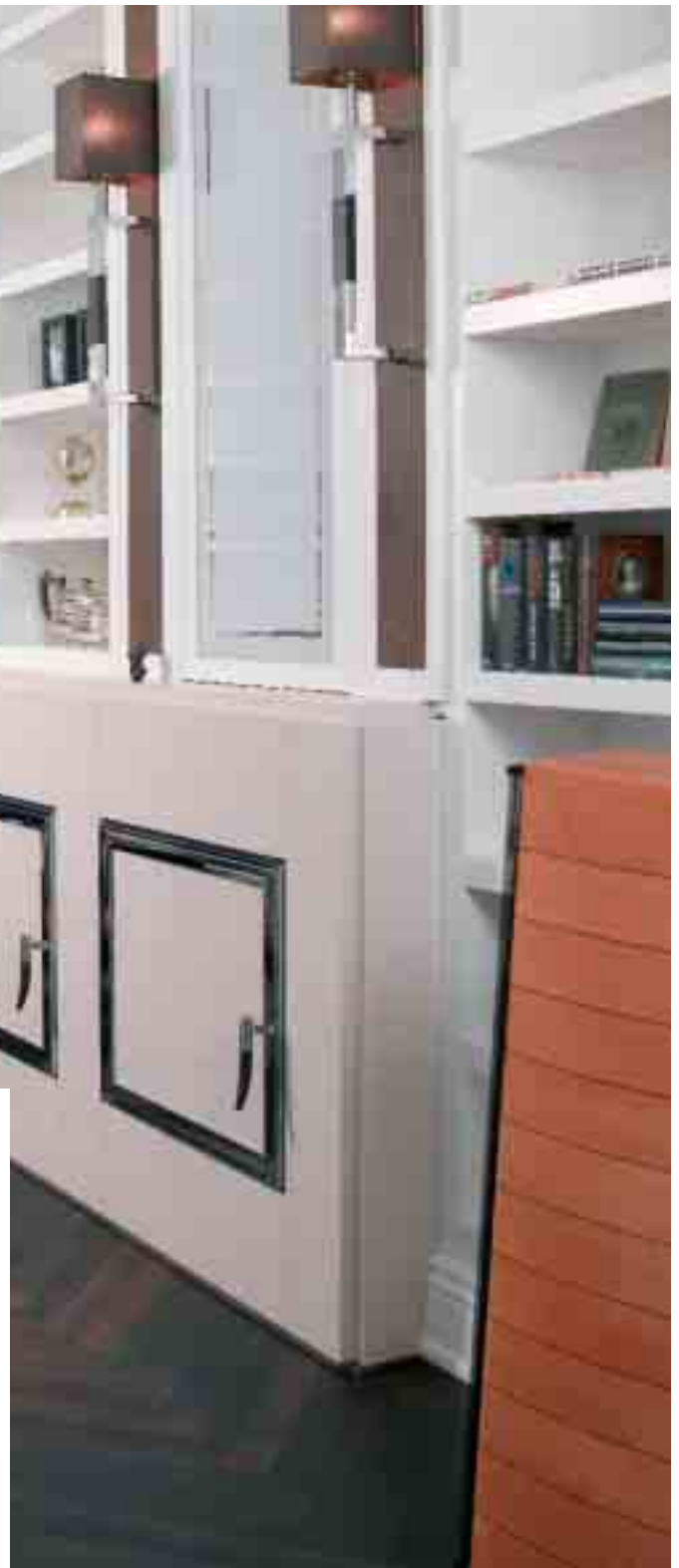
Hinter soliden Türen verbirgt sich die audiophile Elektronik von AVM, die einzig der Musikwiedergabe in der Bibliothek dient