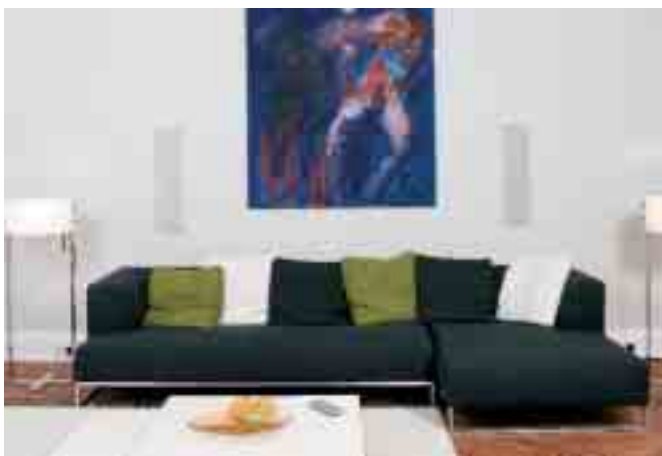
Über dem Sofa sind zwei der Inwall-Lautsprecher zu erkennen, die hier zum Einsatz kommen