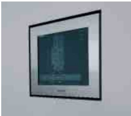
Das Visiomatic Touchpanel erlaubt Zugriff auf alle Informationen und Bedienmöglichkeiten