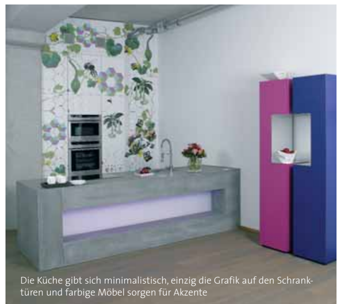
Die Küche gibt sich minimalistisch, einzig die Grafik auf den Schrankfronten und farbiges Möbel sorgen für Akzente

Die Arbeitsplätze selbst sind extrem reduziert. Die speziell entworfenen Tische mit den schlanken Metallbeinen, eine Leuchte, dazu einge-