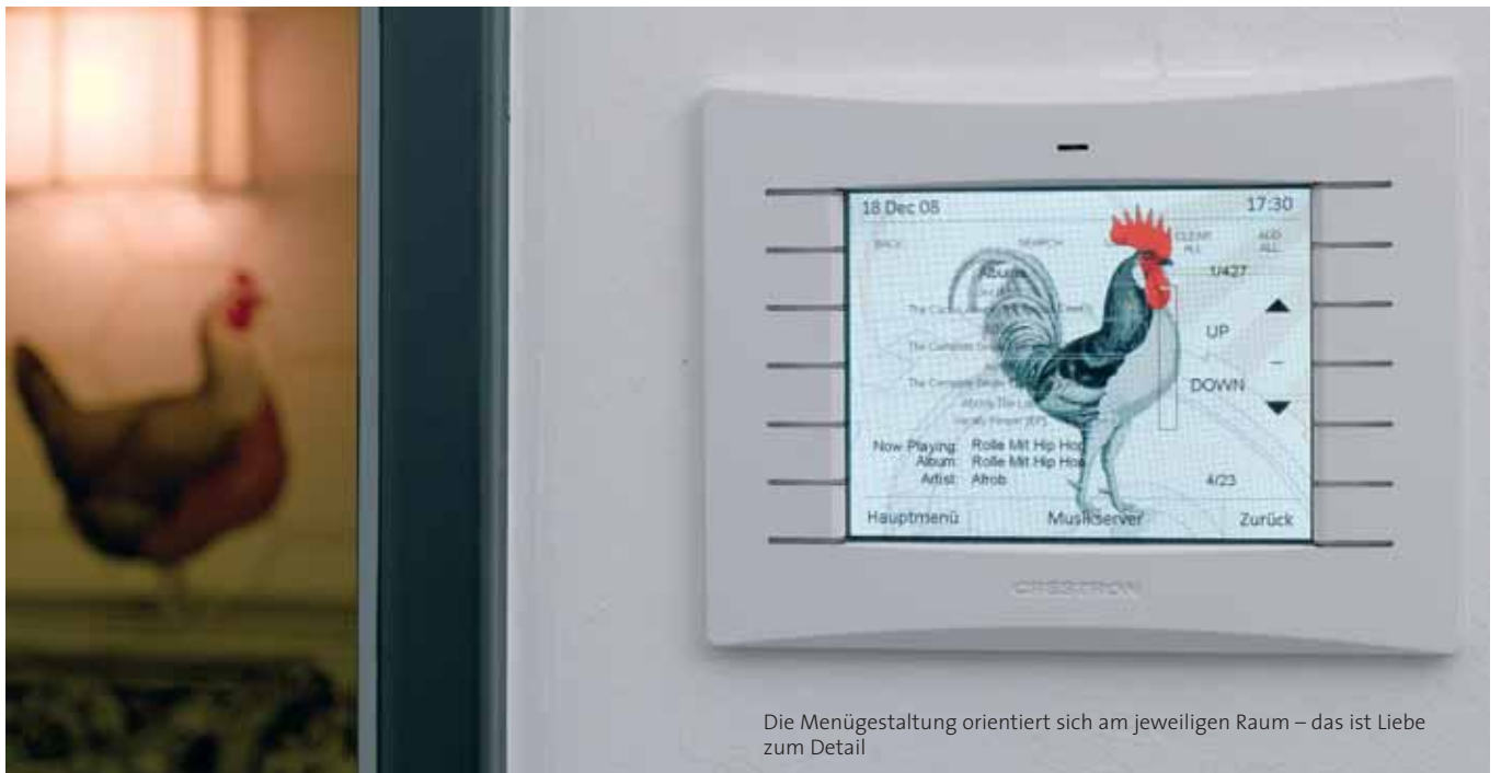
Die Menügestaltung orientiert sich am jeweiligen Raum – das ist Liebe zum Detail

Doch Architektur und Interieur sind nicht die einzigen Glanzpunkte dieses Büros, auch technisch ist hier einiges geboten. Die komplette Licht und Mediensteuerung übernimmt ein System von Crestron. Lichtszenen werden über hauseigene Relais und Dimmer realisiert, und die Heizungssteuerung über motorische Stellventile liegt eben-