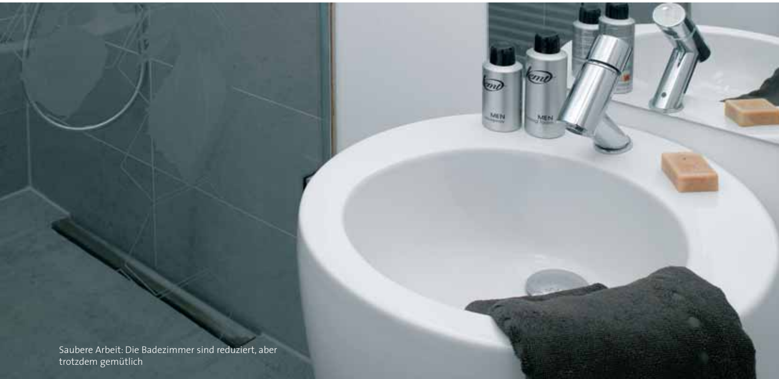
Saubere Arbeit: Die Badezimmer sind reduziert, aber trotzdem gemütlich

lassene Anschlüsse für Strom und Netzwerk – hier hält man fast zwanghaft Ordnung, um den visuellen Gesamteindruck nicht zu zerstören. Einzig dort, wo sich die Buchhaltung ausbreiten wird, durfte ein Regal in die weiße Hohlkehle eingelassen werden. Auch im Besprechungsraum herrscht Minimalismus – ein Tisch samt Bestuhlung sowie ein Sideboard definieren die Möblierung, in der auch hier vorhandenen Rundung ist das multimediale Equipment für Präsentationen verbaut. Bei Bedarf kann noch eine Leinwand heruntergelassen werden.